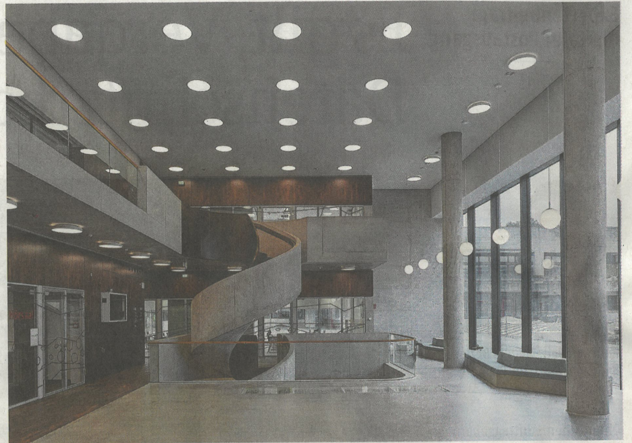
Über eine Wendeltreppe und eine Galerie erreicht man auf kurzem Weg die Lehrräume im Obergeschoss.

Für das Gebäude mit seinen rund 10 000 Quadratmetern Nutzfläche habe man keine weitere Flächen versiegeln müssen, betont Hölting. Denn der Standort sei zuvor der Großparkplatz für den Campus Morgenstelle gewesen, der wegen des veränderten Mobilitätsverhaltens hin zu Fahrrad und öffentlichem Nahverkehr nicht mehr benötigt werde.